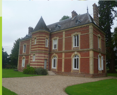
Le manoir du Caillebourg